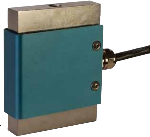
LCCE-250, 售价, 图片为实际尺寸。

当过载条件消失后，称重传感器解锁并且恢复正常功能。这种称重传感器拥有不锈钢传感元件，是市售传感器中最结实耐用的型号。