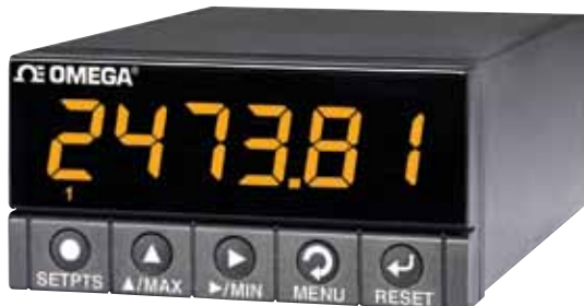
DP41-B, 图片所示小于实际尺寸, 参见 cn.omega.com/dp41b