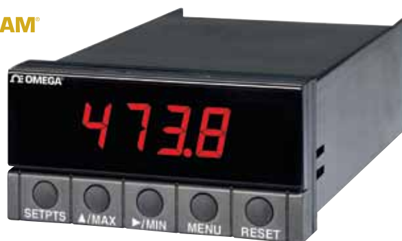
DP25B-E, 图片小于实际尺寸, 参见 cn.omega.com/dp25b