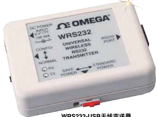
WRS232-USB无线变送器， 图片接近实际尺寸。