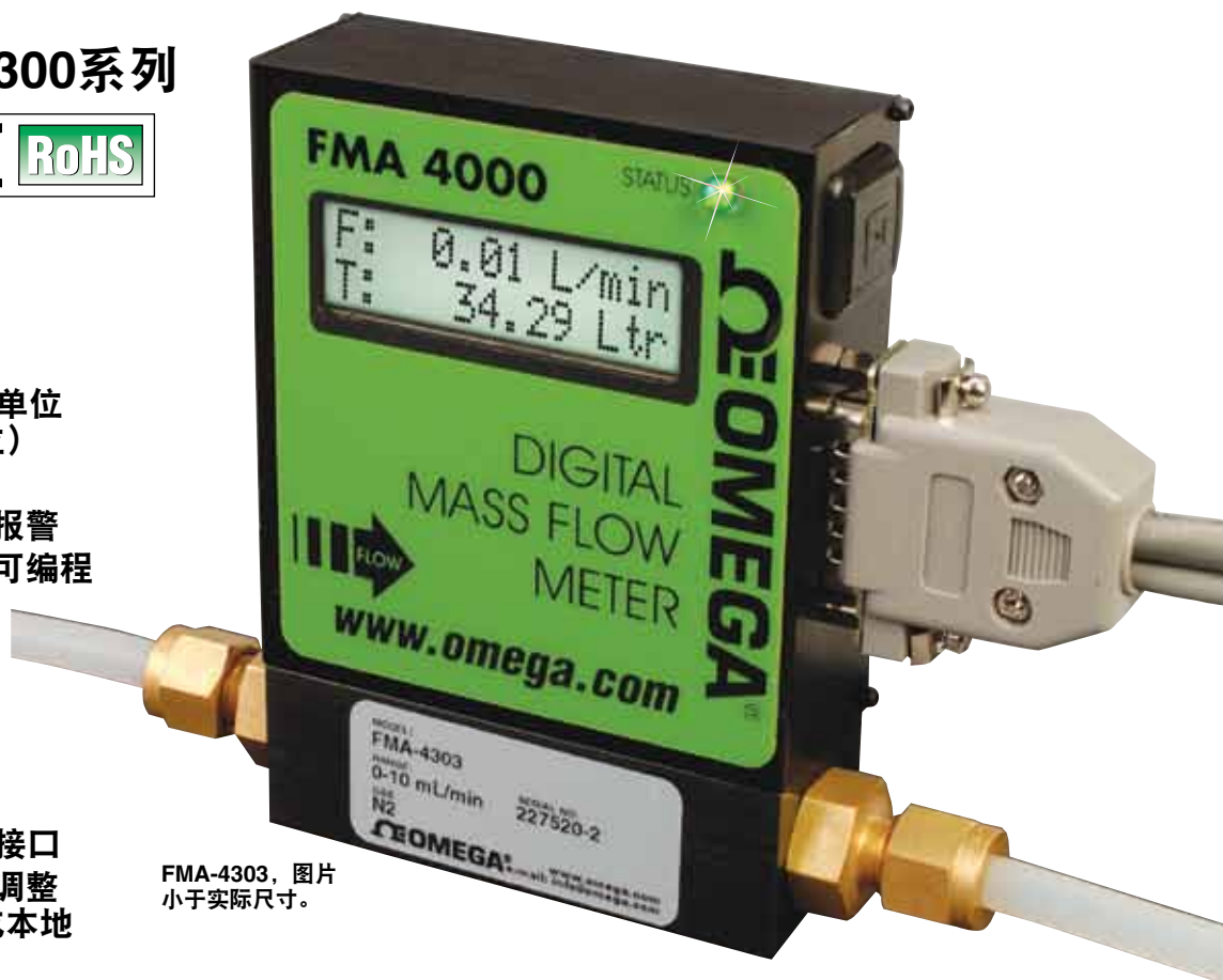
FMA-4303, 图片 小于实际尺寸。

校准： 除非另有要求或者另有说明，否则校准在标准条件[101.4 kPa (14.7 psia)和21.1°C (70°F)]下进行 环保要求（根据IEC 664）： 安装等级II；污染等级II 流量精度（包括线性度）： 在校准温度和压力时为满量程的±1% 重复性： 满量程的±0.15% 流量温度系数： 满量程的0.15%/°C或更佳 流量压力系数： 满量程的0.01%/psi (6.895 kPa)或更佳