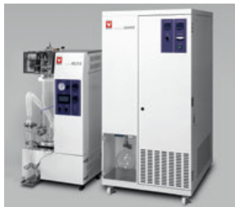
设置例: ADL311S-A+架台 (选购)+有机溶剂回收装置GAS410