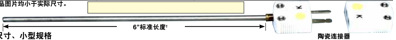
标准尺寸、小型规格