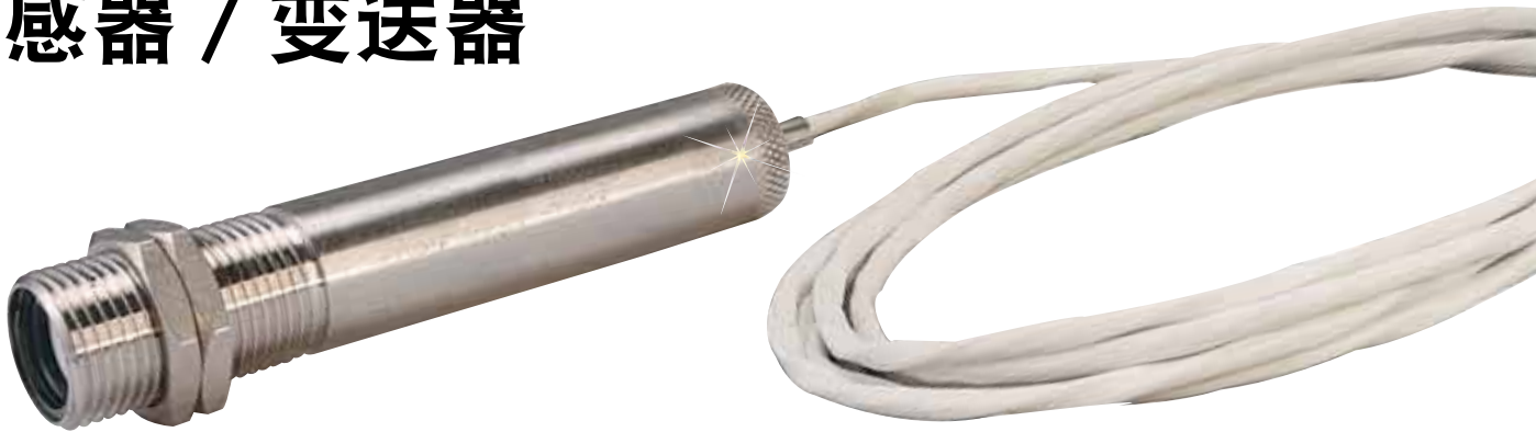
OS136小型不锈钢传感器 / 变送器, 带NEMA 4外壳, 图片为实际尺寸。

由 Foxit PDF Editor 编辑 版权所有 (c) by Foxit Software Company, 2003 - 2009 仅用于评估。