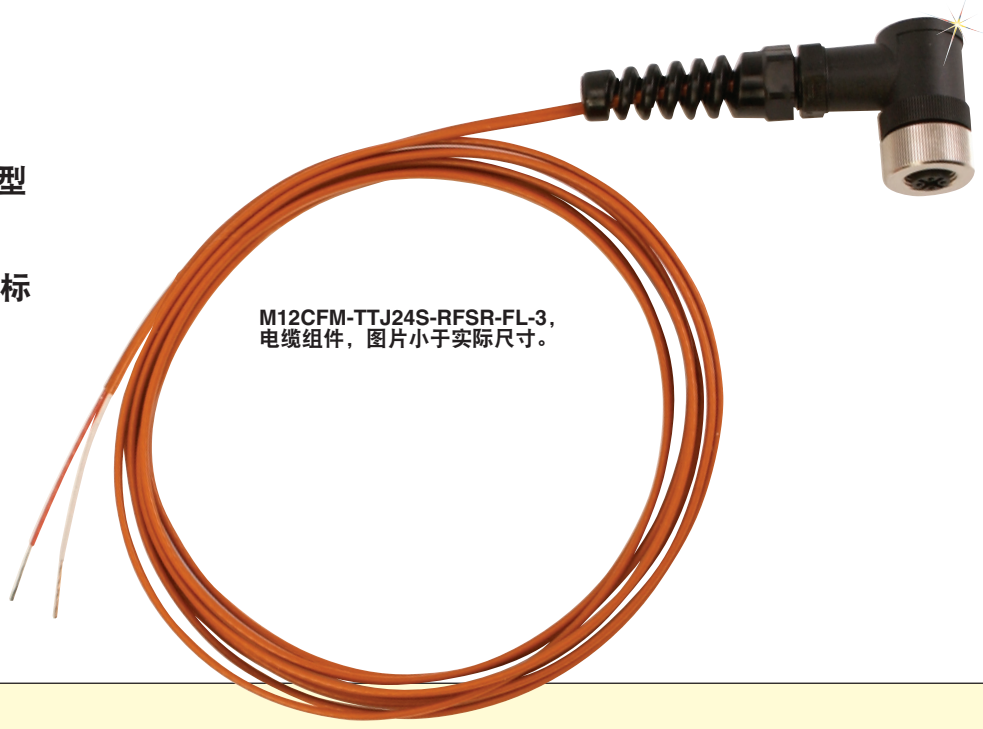
M12CFM-TTJ24S-RFSR-FL-3, 电缆组件, 图片小于实际尺寸。