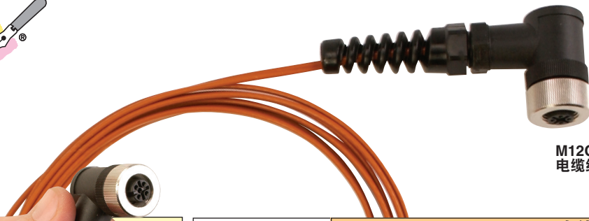
M12CFM-TTJ24S-RFSR-FL-3, 电缆组件, 图片小于实际尺寸。