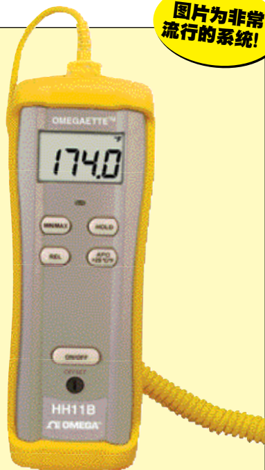
KTSS-HH探头与HH11B手持式数字温度计。