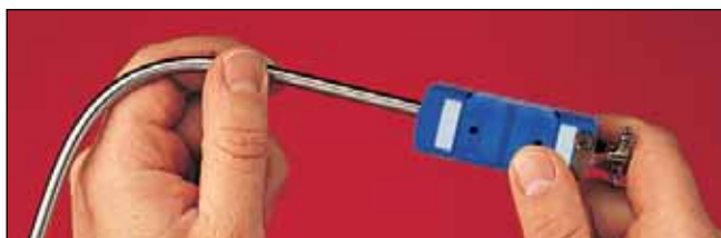
由特殊误差限的OMEGA CLAD®线制成。探头可弯曲至直径的2~3倍之间

OMEGA® 快速脱开模塑热电偶组件可配备直径为 1.5、3、4.5和6 mm ( \frac{1}{16} 、 \frac{1}{8} 、 \frac{3}{16} 和 \frac{1}{4} ") 的金属护套，标准标称长度为300、450和600 mm (12、18和24")。也可提供定制长度，请咨询销售部门了解详情。