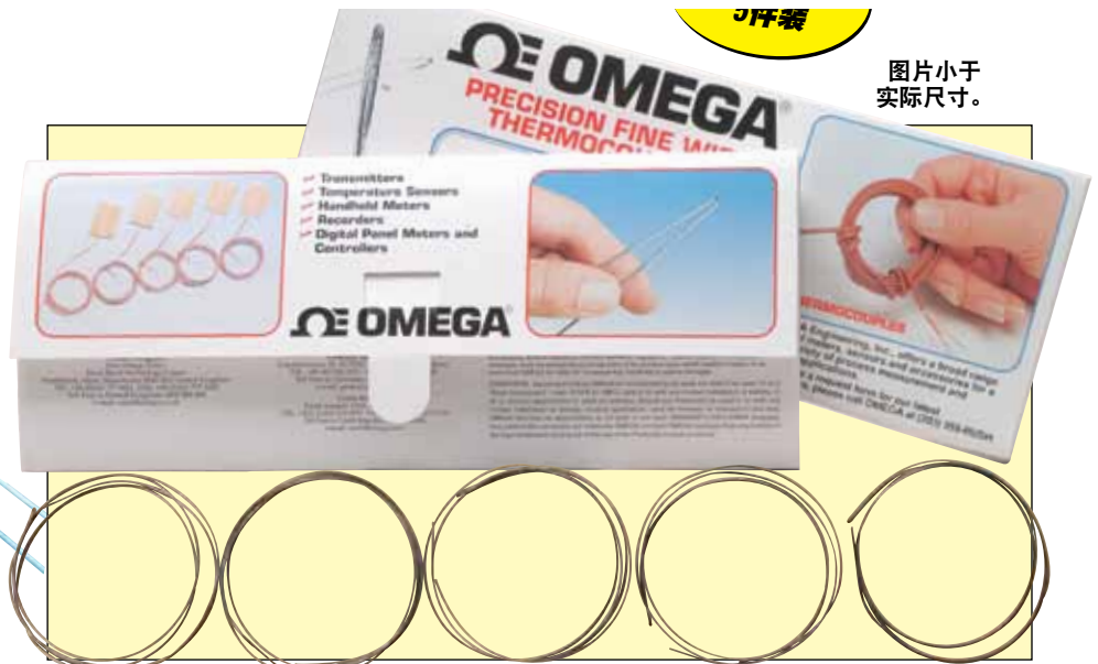
图片小于实际尺寸。