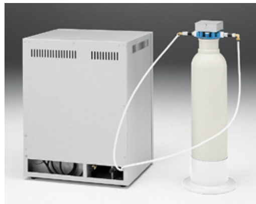
连接组件G (WL100+WG250型连接例)