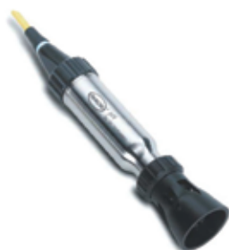
坚固型电极： 现场使用