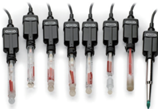
IntelliCAL Red Rod和专业pH电极