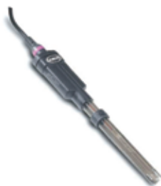
标准型电极： 实验室使用