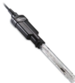
Ultra pH电极 纯水使用