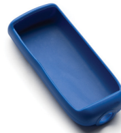
HI710029 蓝色防震防滑保护护套